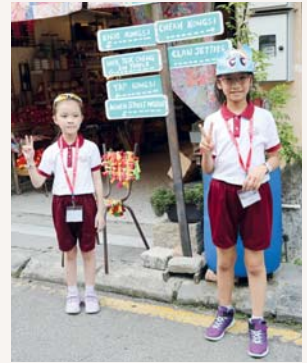
我們開心心地逛街