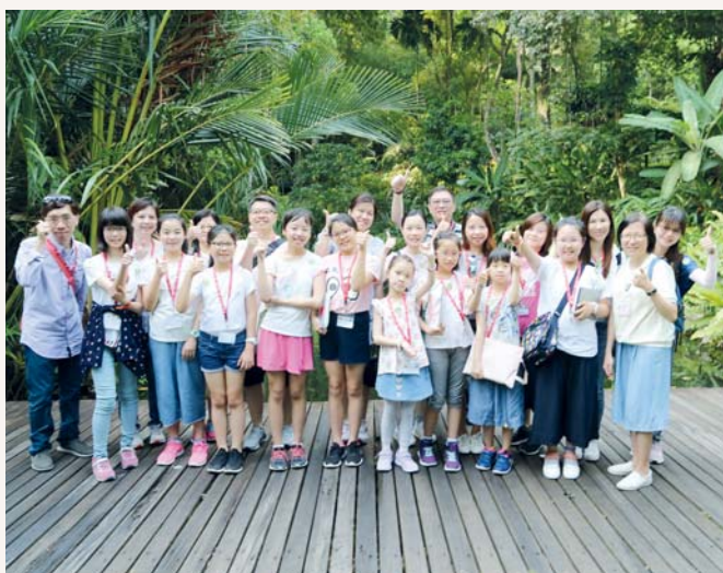
離開前，我們來一張合照