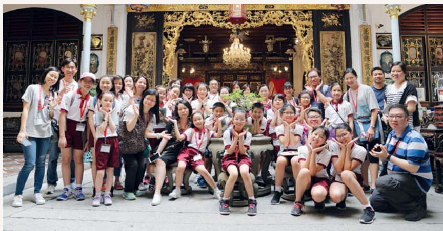
這是我們第一站：娘惹博物館