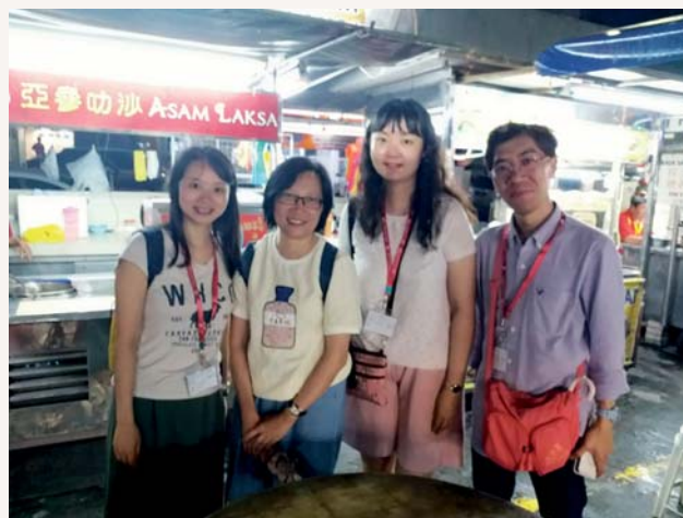
晚上，我們夜遊新關仔閣大排檔