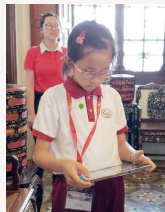
同學運用平板電腦進行學習