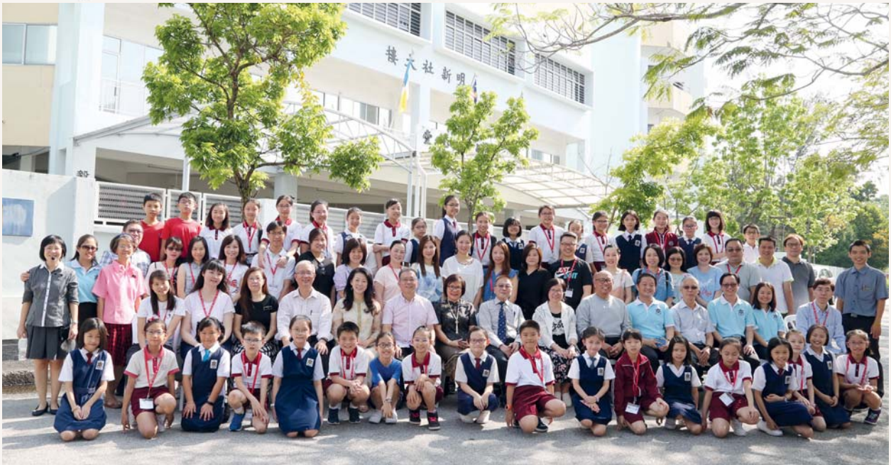
我們來到檳城明新小學交流