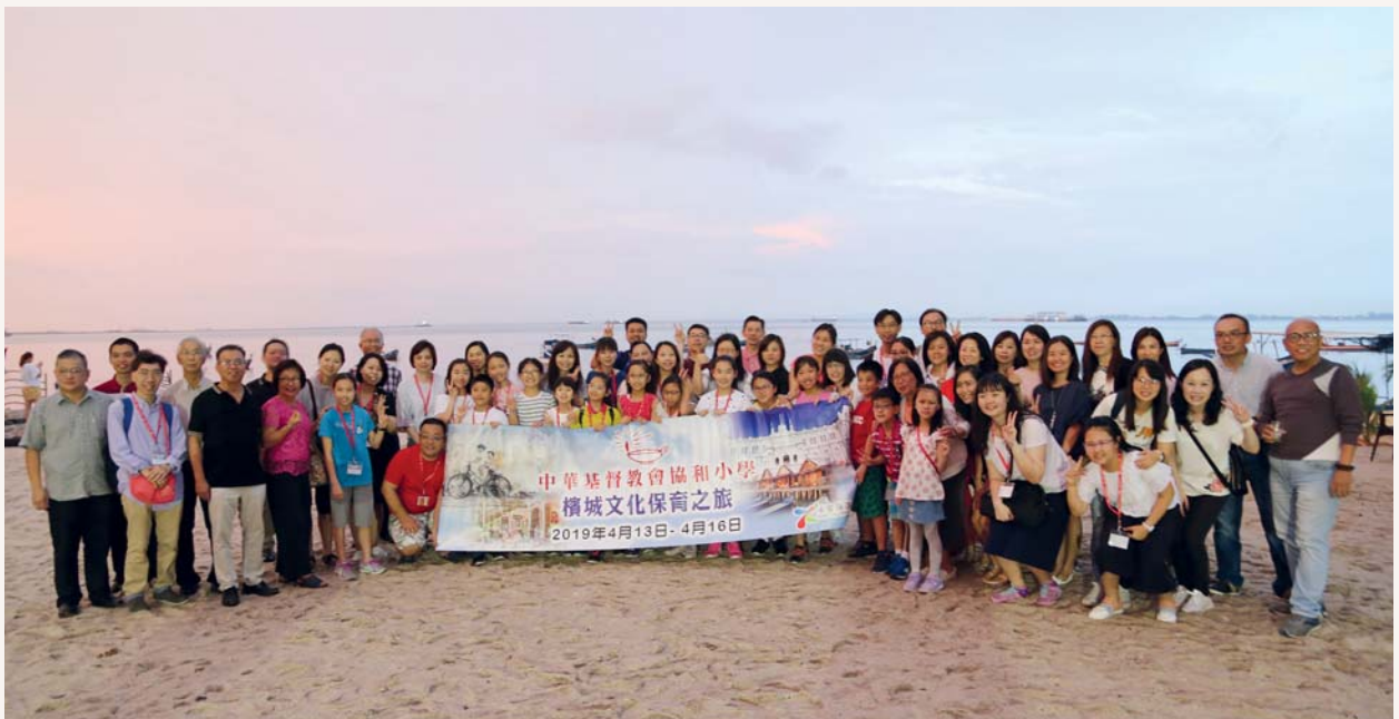
晚上我們出席檳城明新小學的歡迎晚宴