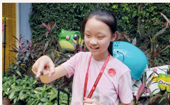
可愛的蝴蝶在我手上