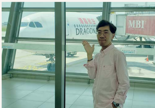
四天的旅程結束了！