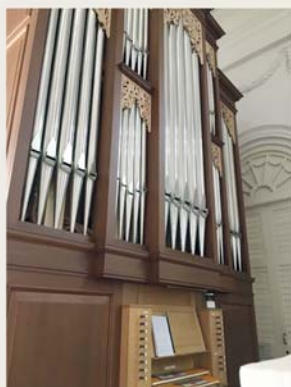
聖喬治教堂內的管風琴