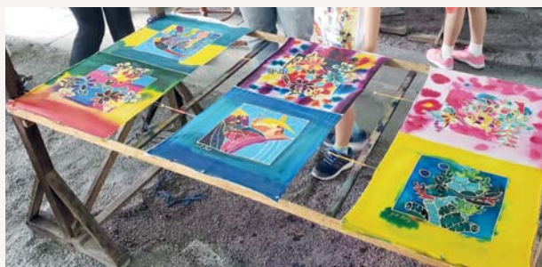
這就是我們的作品