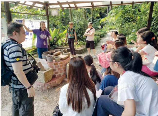
我們學習熱帶香料的知識