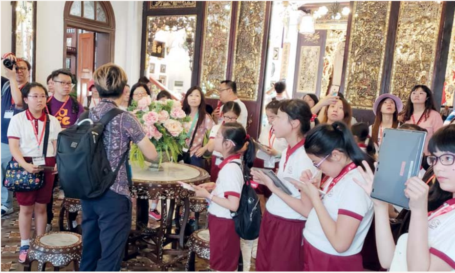
博物館中有很多值得我們觀賞的文物