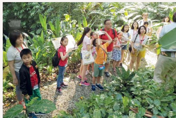
我們聆聽導賞員的講解