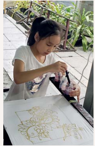
同學們可以自己製作染布了