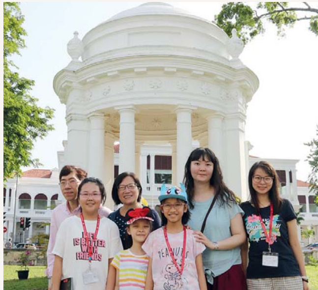
美麗的教堂，怎可不留情影呢？(蔡主任你不應上鏡啊！)