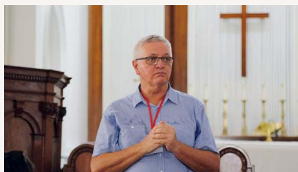
教堂義工為我們介紹教堂的歷史