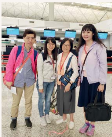
我們齊心合力， 為大家帶來美好的遊學團