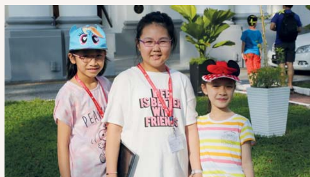
女孩子們開心的笑臉