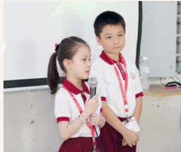
之後我們介紹表演活動