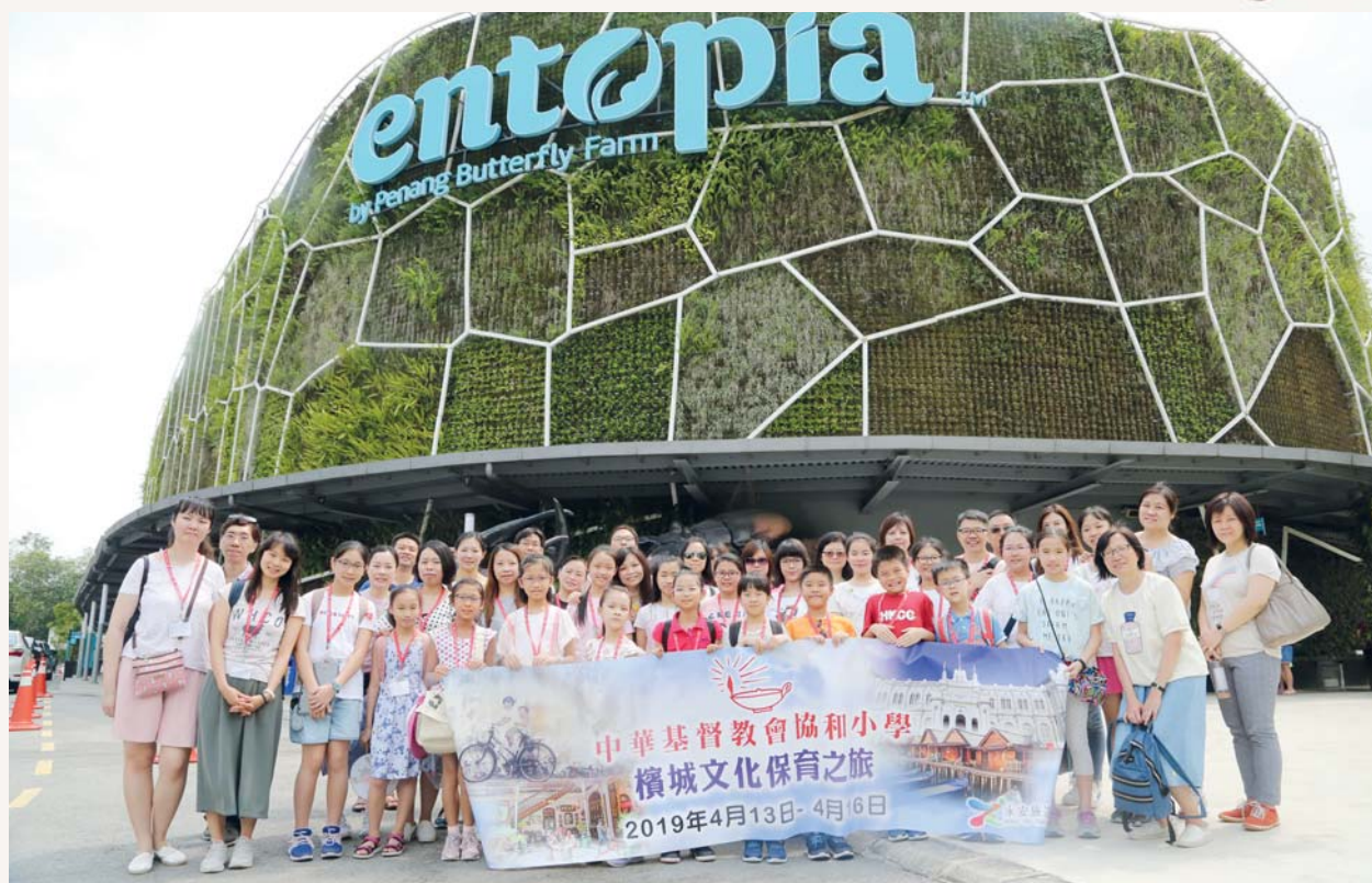
之後我們來到蟲鳴大地