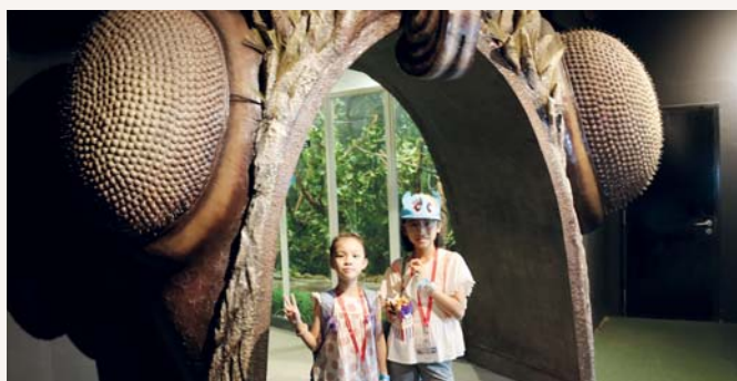
我們一起尋幽探秘