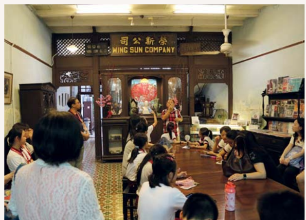
同學們都耐心地聆聽