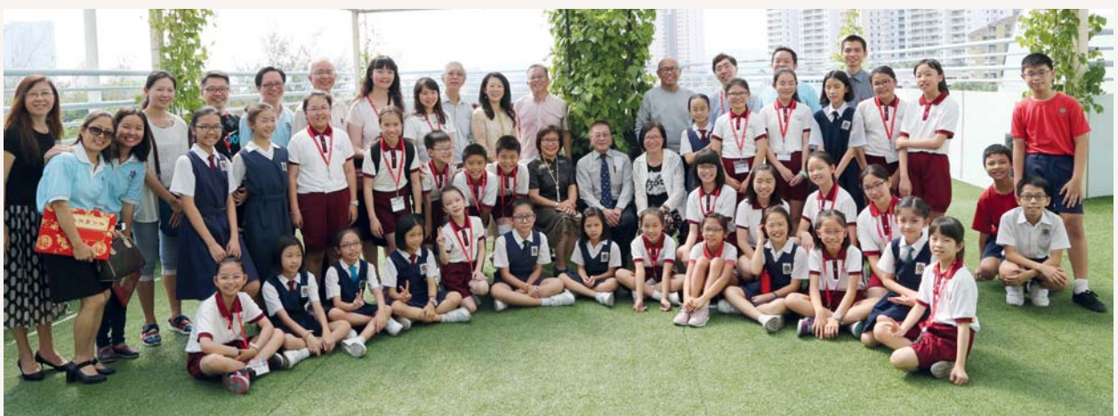
參觀校園後，大家來一個大合照