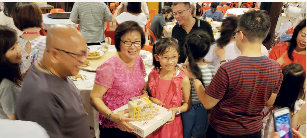
我們互相交換紀念品