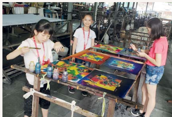
成功的滿足感，不能言喻