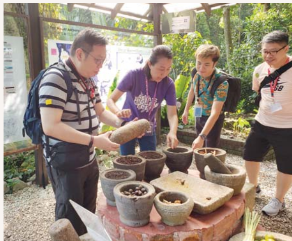
家長們可以親身體驗製作香料