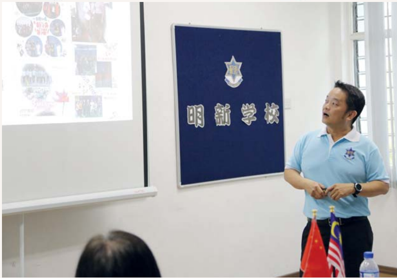
我們聆聽老師為我們介紹檳城