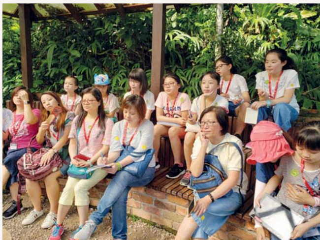
雖然天氣十分炎熱，但我們亦耐心地學習