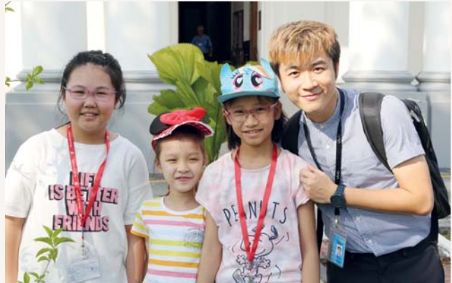
導遊哥哥和我們合照啊！