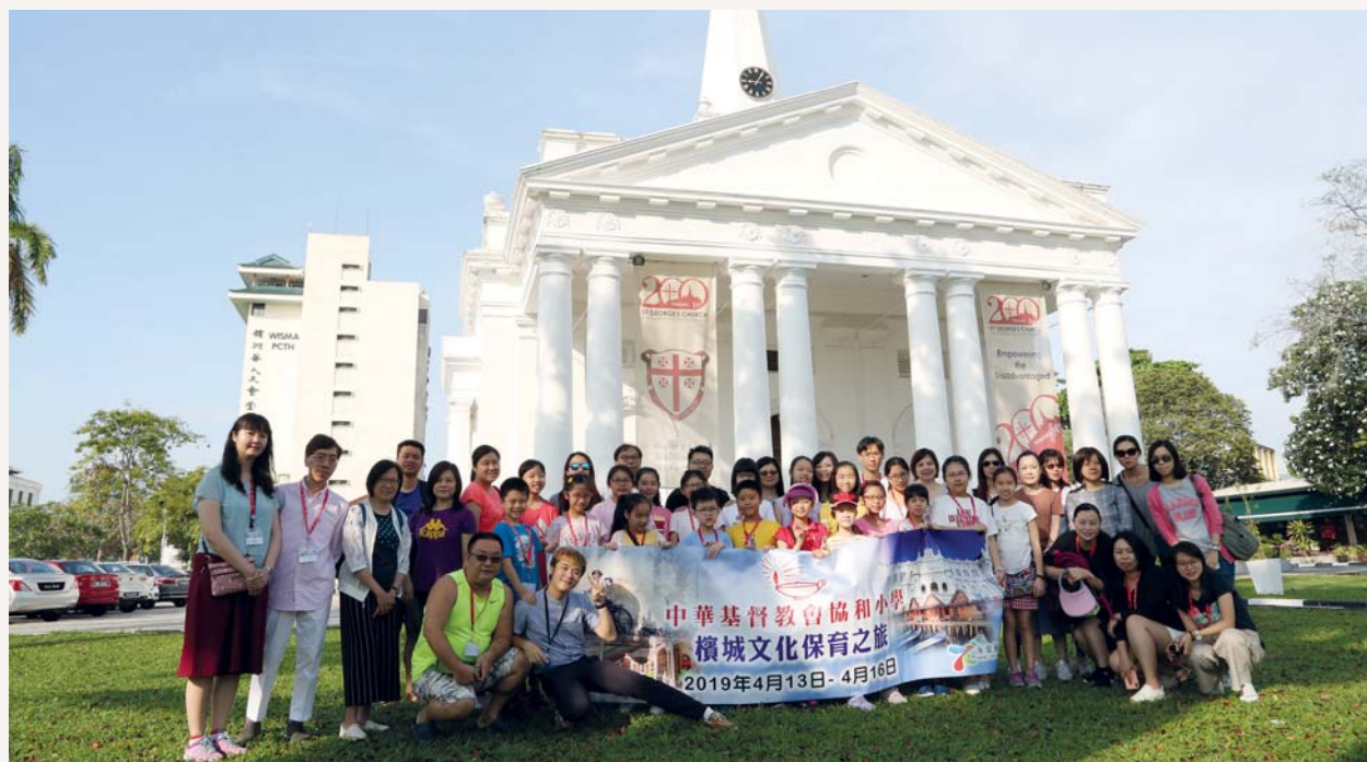
黃昏時，我們來到康華麗斯古堡

今天是行程的最後一天，我們早上來到聖喬治城教堂參觀。我們可以進入教堂，聆聽神職人員的介紹，真的太幸運了！因為聽說這裏不是每天都開放，也不一定有專人進行介紹。