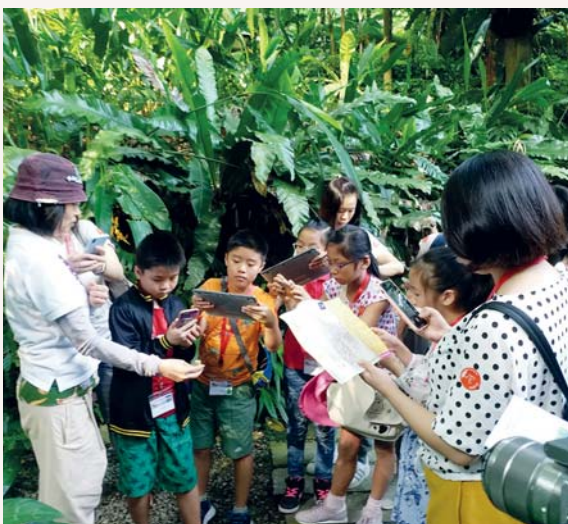
我們運用平板電腦進行自學