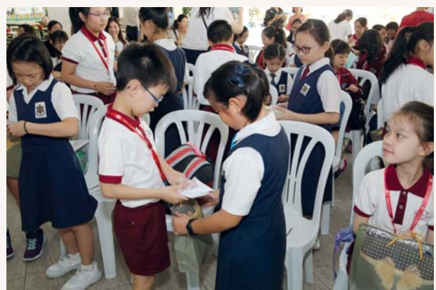
兩所小學的學生進行交流活動