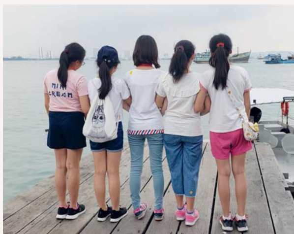
二十年後，你還記得我是誰嗎？