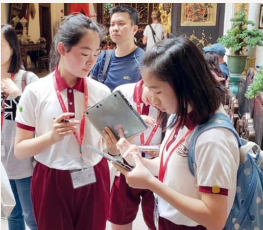
我們可以在網絡上找到和娘惹相關的訊息呢