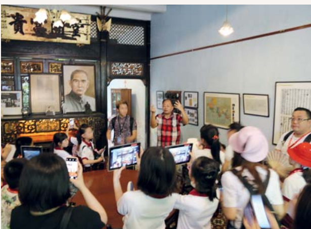
之後我們來到孫中山檳城基地紀念館