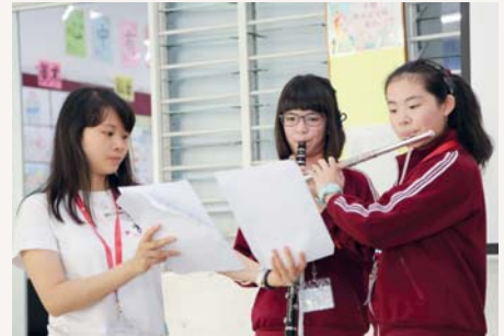
我們先表演一首曲子