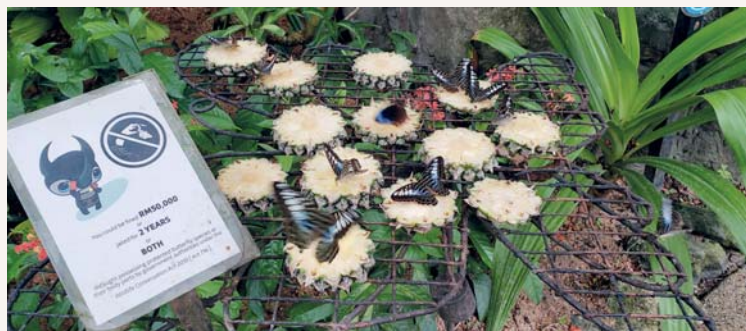
園中有大量的蝴蝶漫天飛舞