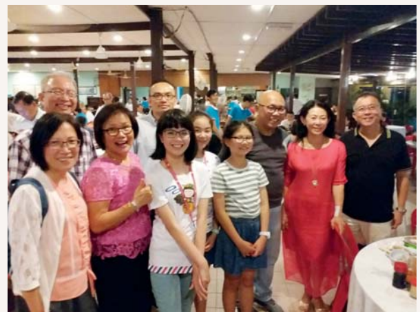
我們和明新小學的朋友們合照