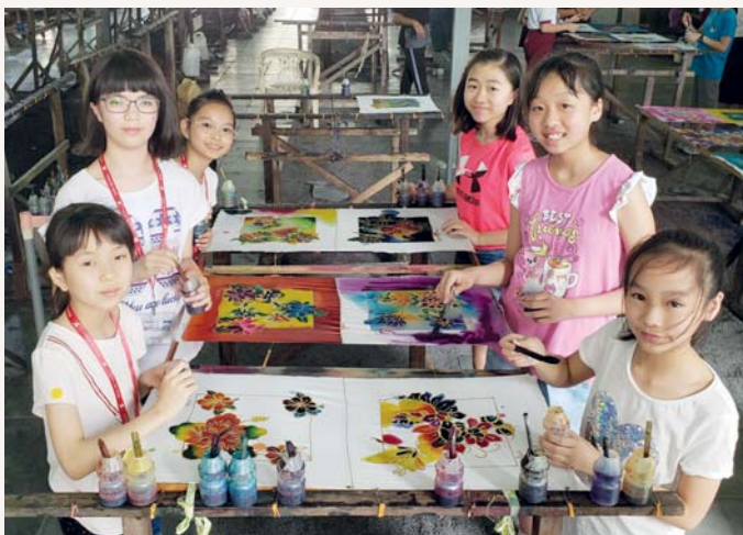
你覺得我們的作品漂亮嗎？