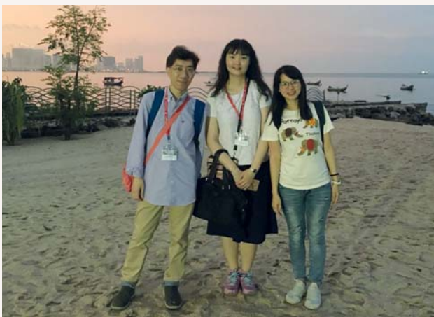
三位老師來一個海旁合照