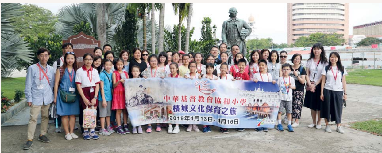
黃昏時，我們來到康華麗斯古堡