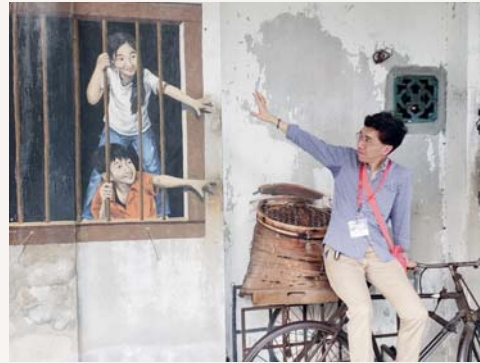
蔡主任想念孩子嗎？