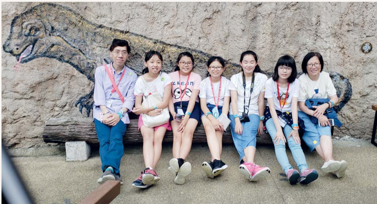
簡校長、蔡主任和六年級學生合照