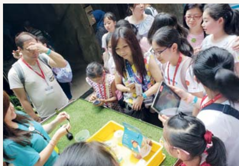
我們欣賞美麗的蝴蝶