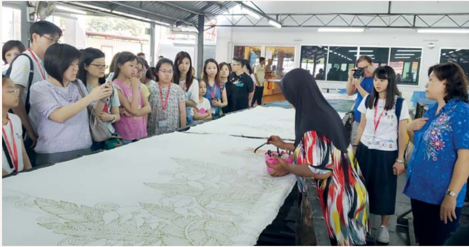
接着我們學習製作染布工藝