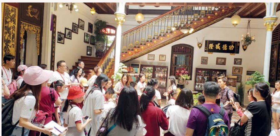
同學們都專心地聆聽講解