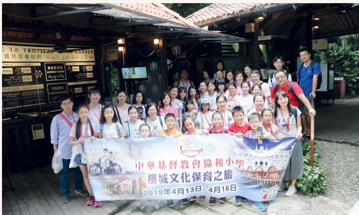
我們早上一起前往熱帶香料園