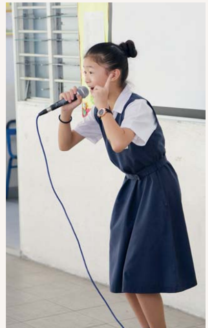
檳城明新小學的學生出色的表演，令觀眾都擊節讚賞