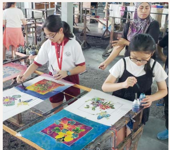
經過一番努力後，作品快將完成了