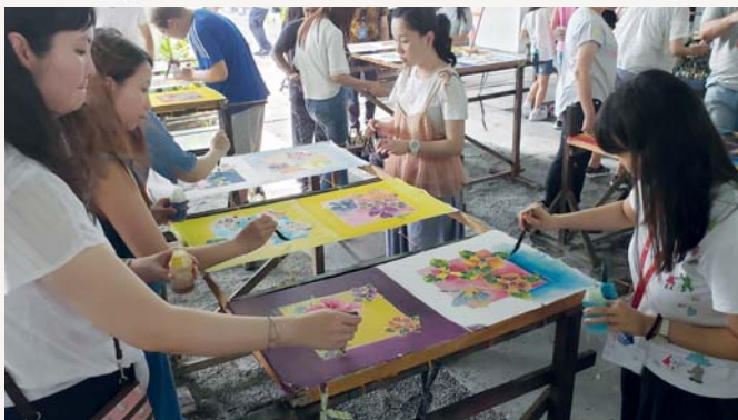
老師們都用心地學習