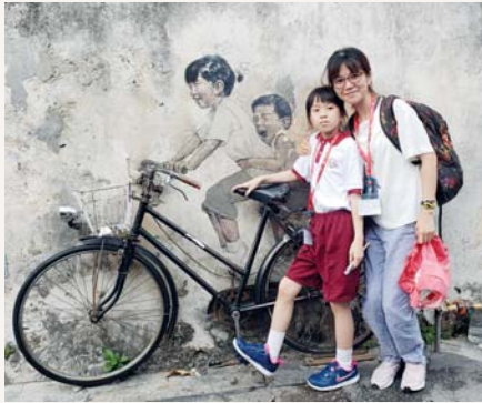
我們來到著名的壁畫彩繪街了