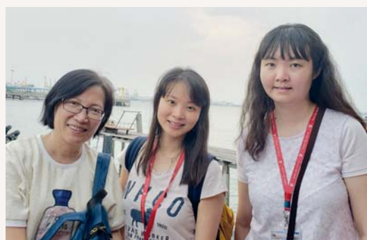
善良的人永遠是最美的