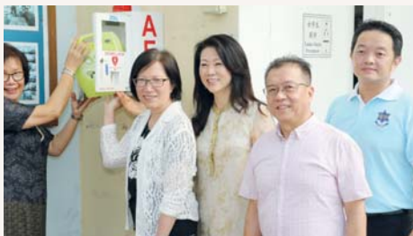
我們參加檳城明新小學的A.E.D.推展禮