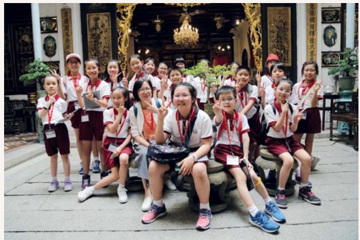
和簡校長一起，樂也融融