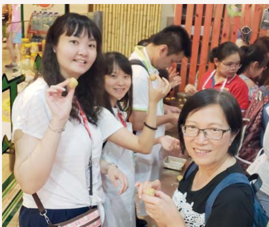
校長老師都學習「整餅」