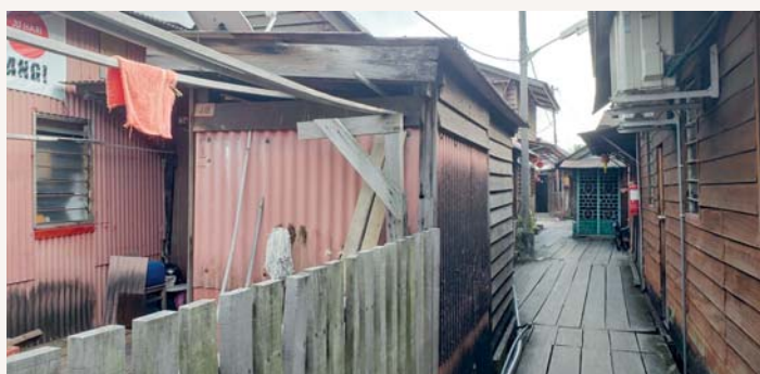
黃昏時，我們來到姓氏橋