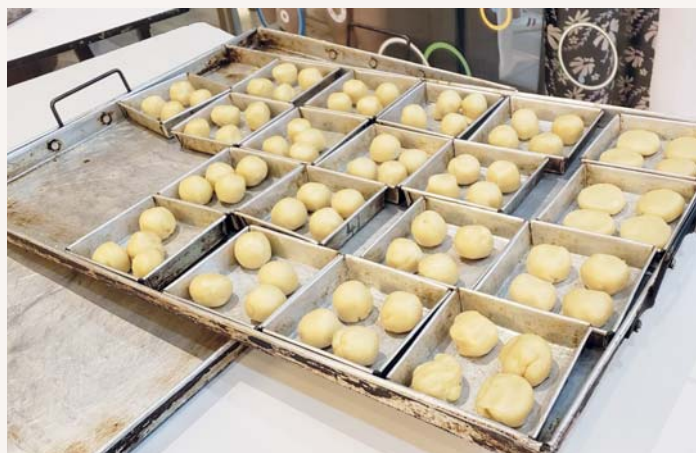
這就是我們的傑件