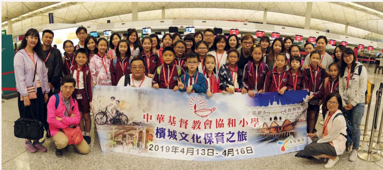
我們準時抵達機場，先來張大合照