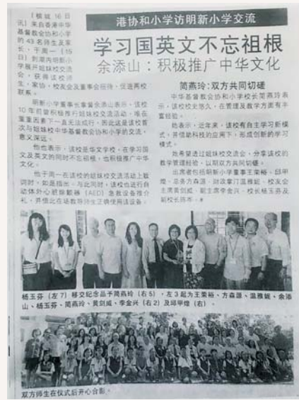
是次交流活動，當地傳媒都有報導