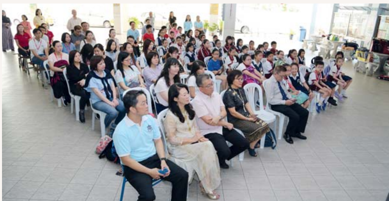
我們齊集禮堂欣賞表演