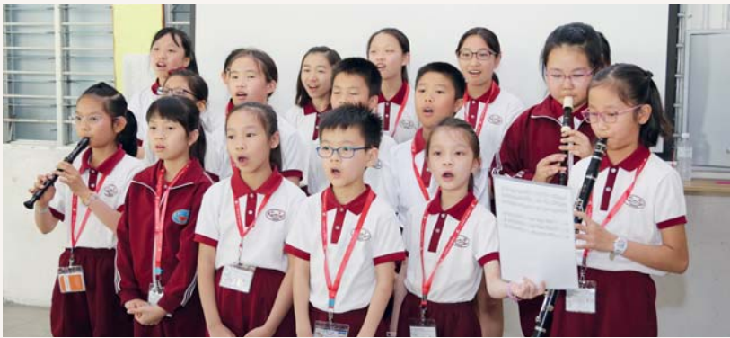
大家練習了多天，終於在檳城表演了