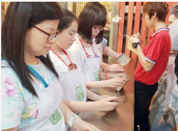
之後我們一起製作糕餅