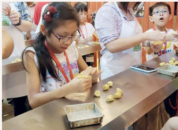
同學們都十分努力